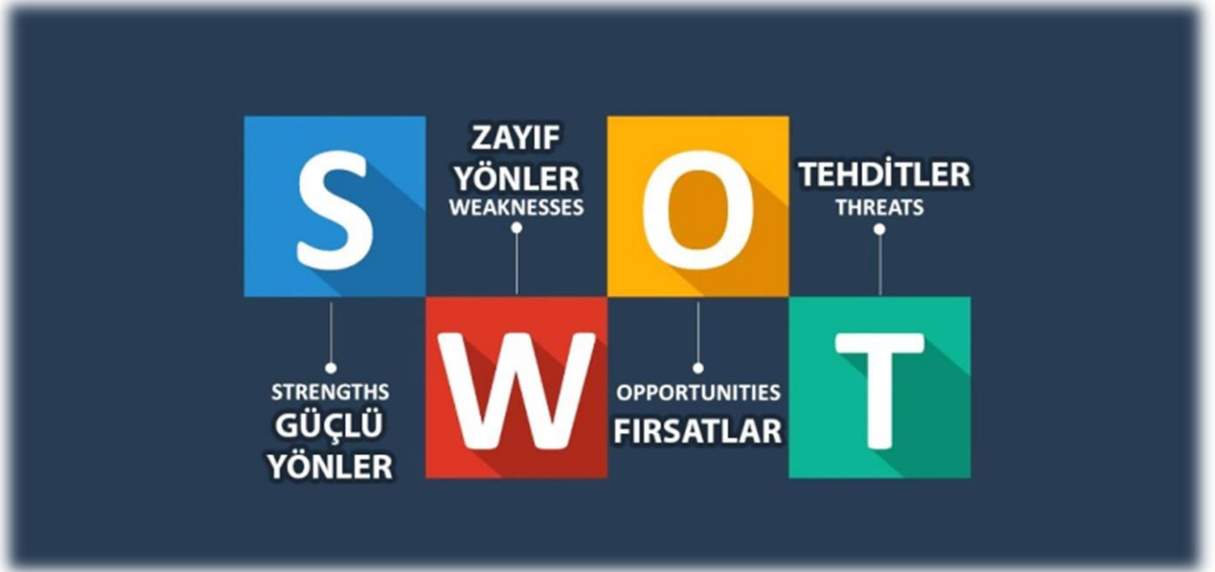
Şekil 2 GZFT Analizi

Kurumun güçlü ve zayıf yönleri donanım, malzeme, çalışan, iş yapma becerisi, kurumsal iletişim gibi çok çeşitli alanlarda kendisinden kaynaklı olan güçlülükleri ve zayıflıkları ifade etmektedir ve ayrımda temel olarak okul müdürü/müdürlüğü kapsamında bakılarak iç faktör ve dış faktör ayrımı yapılmıştır.